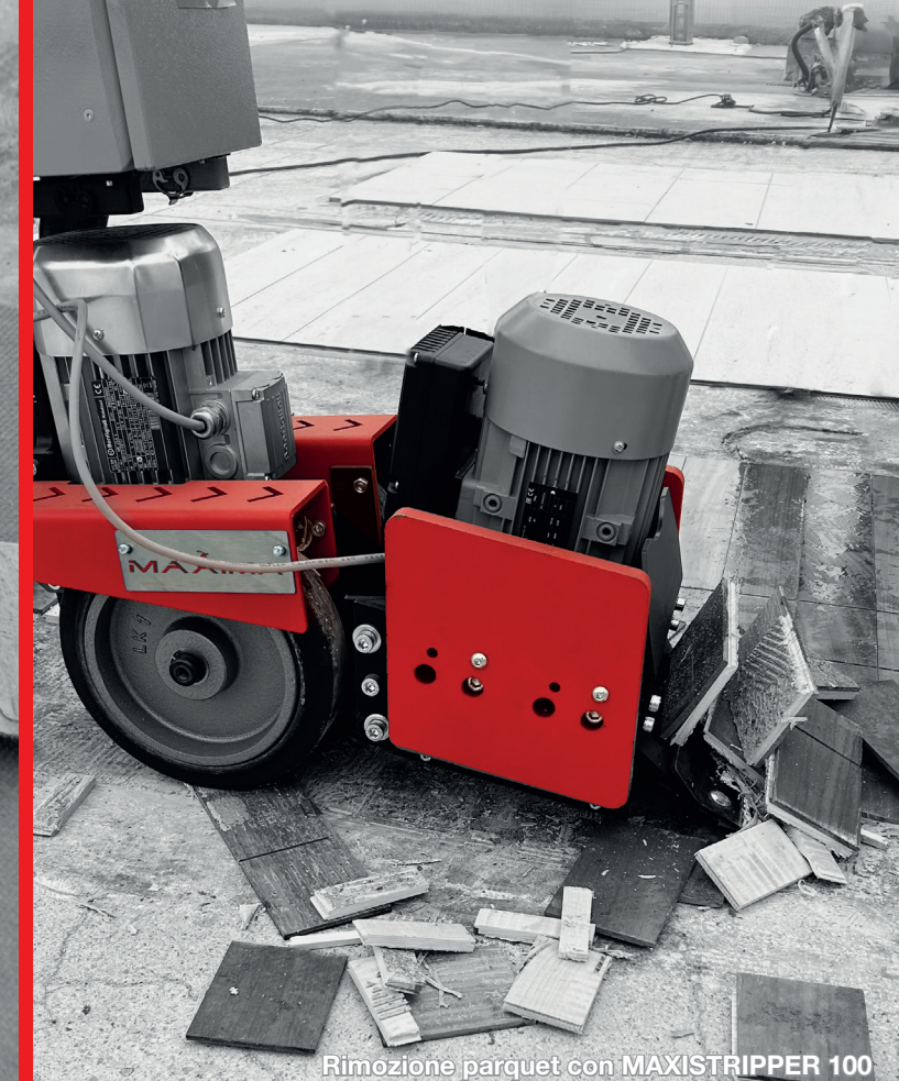
Rimozione parquet con MAXISTRIPPER 100