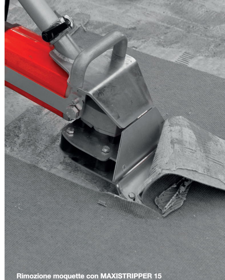
Rimozione moquette con MAXISTRIPPER 15

Motore avanzamento: elettrico monofase 230V 0,75 kW Motore operativo: elettrico monofase 230V 1,1 kW Coppia 145 Nm Dimensioni (H x P x L): 640 x 1080 x 305 cm Peso: 95 kg (escluso zavorra aggiuntiva)