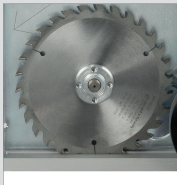
Altezza di taglio regolabile 0-22 mm