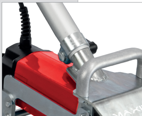
Manico separabile dal motore e regolabile