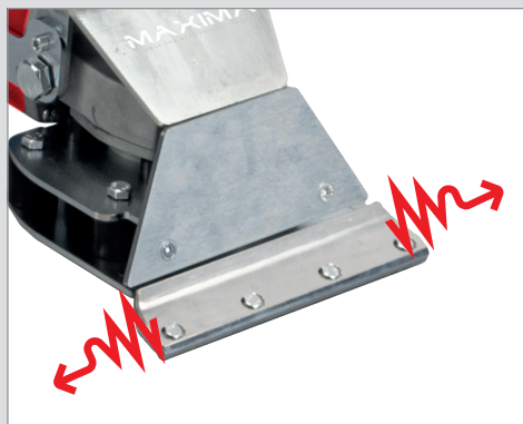
Due tipi di lame intercambiabili (vedere tabella accessori) con efficace sistema ad oscillazione